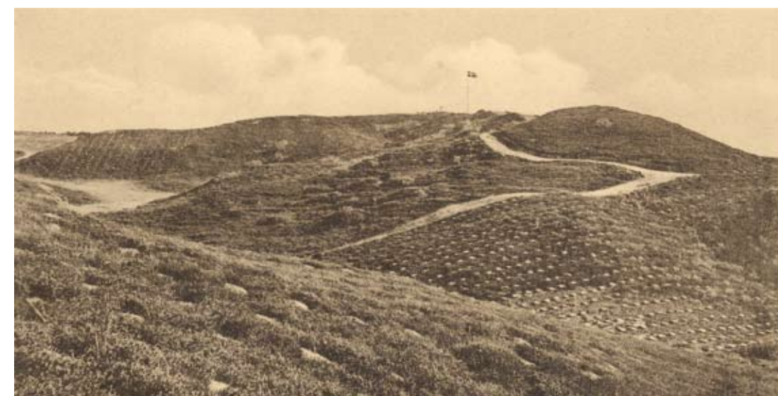
Tislum Bakker kort tid efter tilplantningen

der skulle graves 72.800 plantehuller og plantes ligeså mange planter. Man fik dengang 2 øre for at grave et plantehul og plantningen gav 5 kr. for 1.000 stk. Det tog 2-3 år at plante området til.